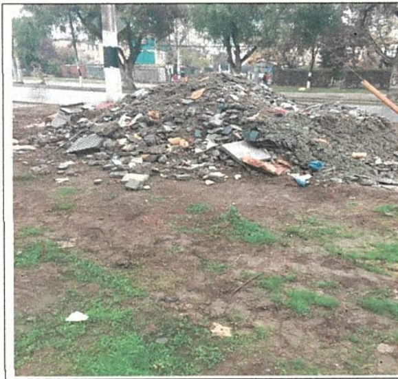
Fotografía N° 1: Escombros en Camino a Rinconada de Maipú frente a la calle Pangal.

(Fechas visitas: 3 de mayo y 8 de junio, ambos de 2017)