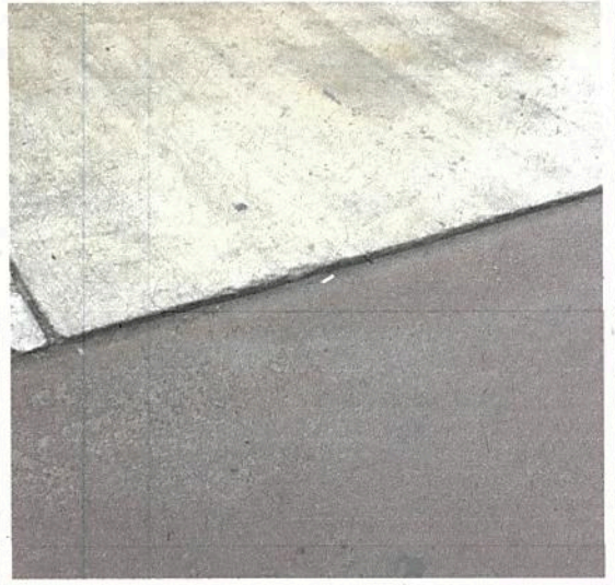
Fotografía N° 4: Desnivel salida vehicular con ciclovia.