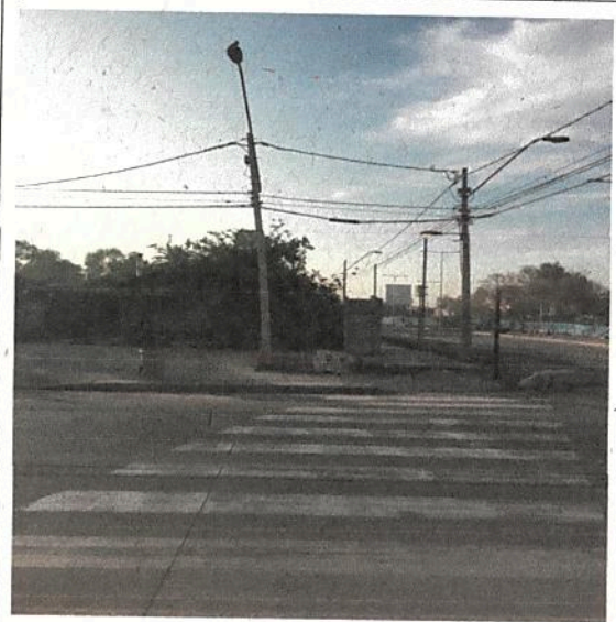
Lamina N° 1: Plano de detalle encuentro salida vehicular y ciclovia.