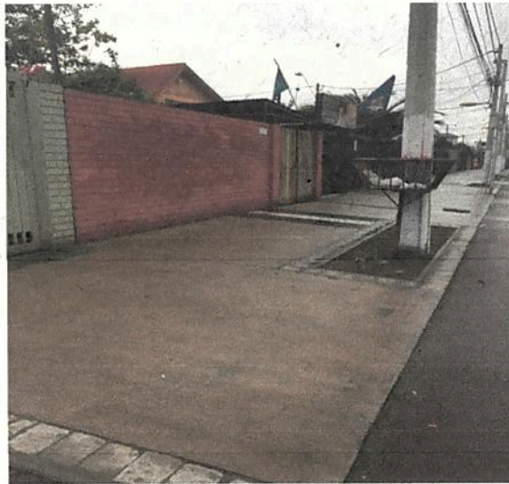
Fotografía N° 3: Desnivel salida vehicular con ciclovia.